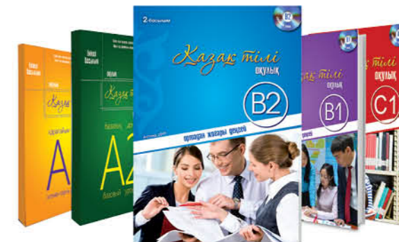
ҚАЗАҚ ТІЛІН ОҚИТУҒА АРНАЛҒАН ОҚУЛЫҚ