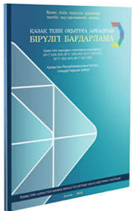
ҚАЗАҚ ТІЛІН ОҚИТУҒА АРНАЛҒАН БІРУЛГІ БАҒДАРЛАМА