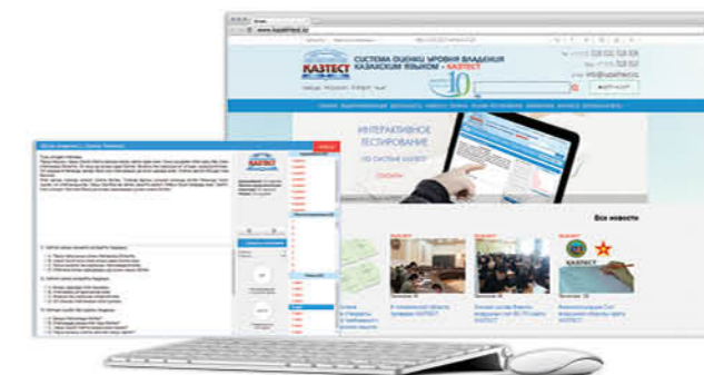
ҚАЗТЕСТ ЖҮЙЕСІНІҢ ВЕБ-САЙТЫ