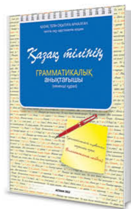
ҚАЗАҚ ТІЛІН ОҚИТУҒА АРНАЛҒАН ГРАММАТИКАЛЫҚ АНЫҚТАҒЫШ