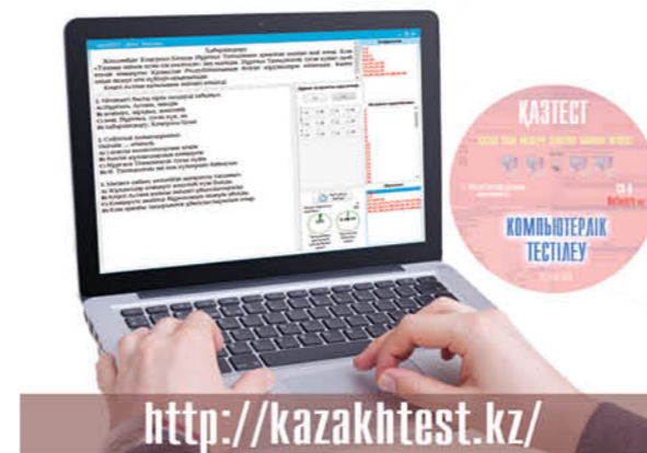
ҚАЗТЕСТ ЖҮЙЕСІ БОЙЫНША КОМПЬЮТЕРЛІК ТЕСТІЛЕУ