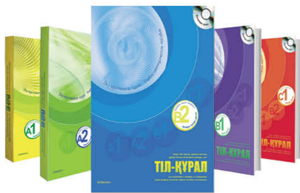
ҚАЗТЕСТ-КЕ ДАЙЫНДАЛУҒА АРНАЛҒАН «ТІЛ – ҚҰРАЛ» ӘДІСТЕМЕЛІК ҚҰРАЛЫ