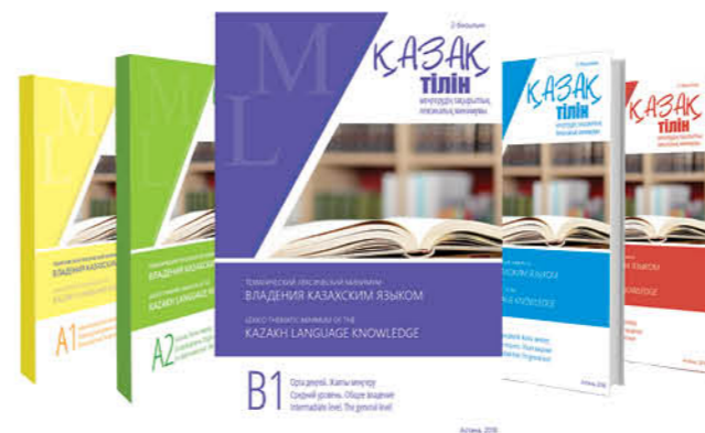
ҚАЗАҚ ТІЛІН МЕНГЕРУДІҢ ТАҚЫРЫПТЫҚ ЛЕКСИКАЛЫҚ МИНИМУМДАР