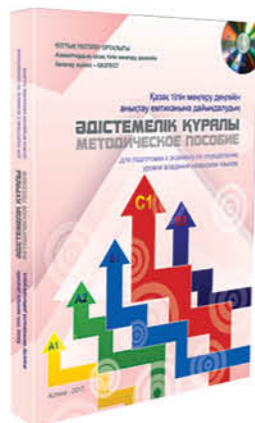
ҚАЗТЕСТ-КЕ ДАЙЫНДАЛУҒА АРНАЛҒАН ӘДІСТЕМЕЛІК ҚҰРАЛЫ